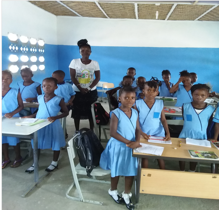
Unterricht in der 3. Klasse