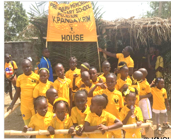
Kpanga Krim House