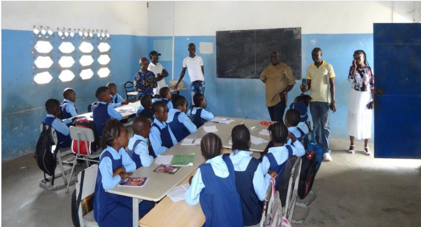
Unterricht in Klasse 4 der Sam-Abu-Schule